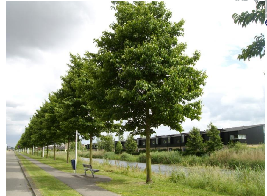
Tuin- en landschapsinrichting